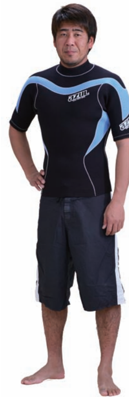
TH FSJ-A 2/2 ¥25,200