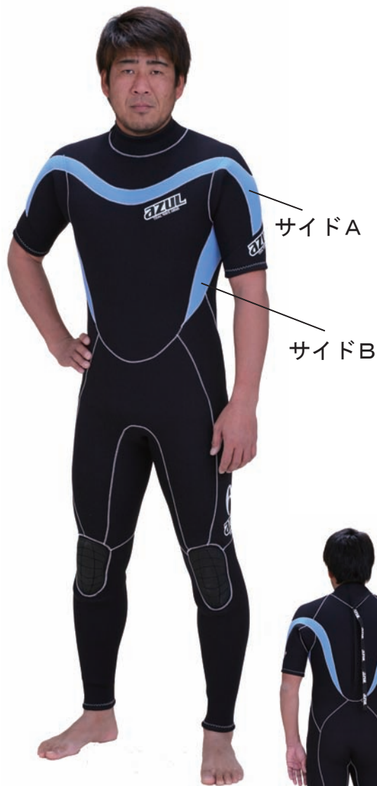
HF FSJ-A 3/2 ¥53,550