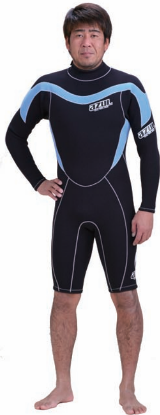
LS FSJ-A 3/2 ¥45,150