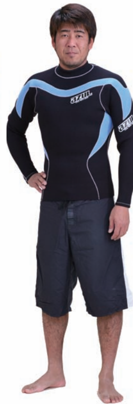
TL FSJ-A 2/2 ¥27,300