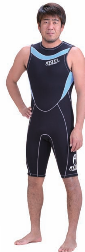
SJ FSJ-A 2/2 ¥30,450