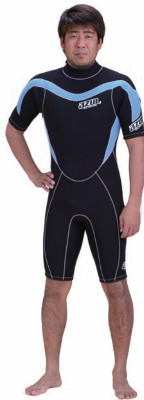
HH FSJ-A 3/2 ¥42,000